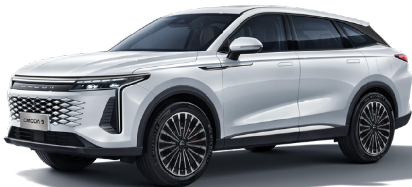
STAR WHITE - lakier metalizowany Bez dopłaty