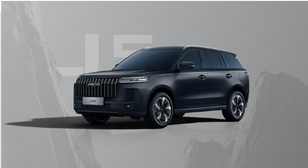
CARBON BLACK (CL)