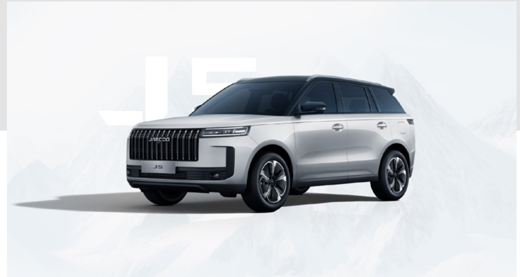
SNOW WHITE Z CZARNYM DACHEM (ZE)