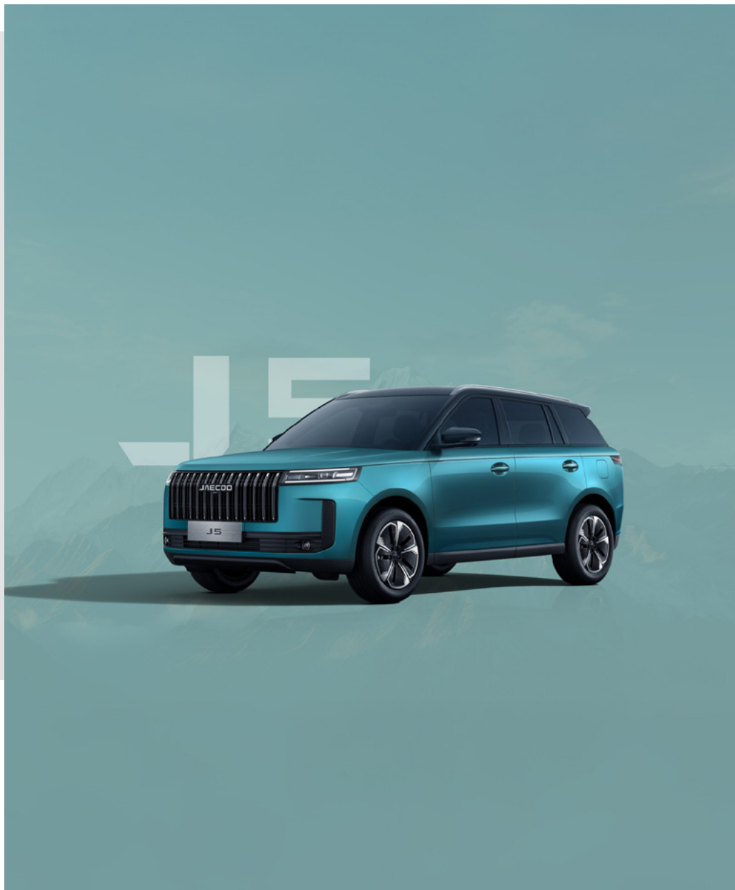
EUCALYPTUS GREEN Z CZARNYM DACHEM (Z6)