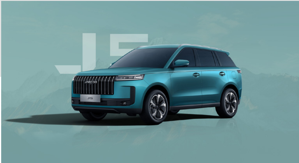
EUCALYPTUS GREEN (LQ)