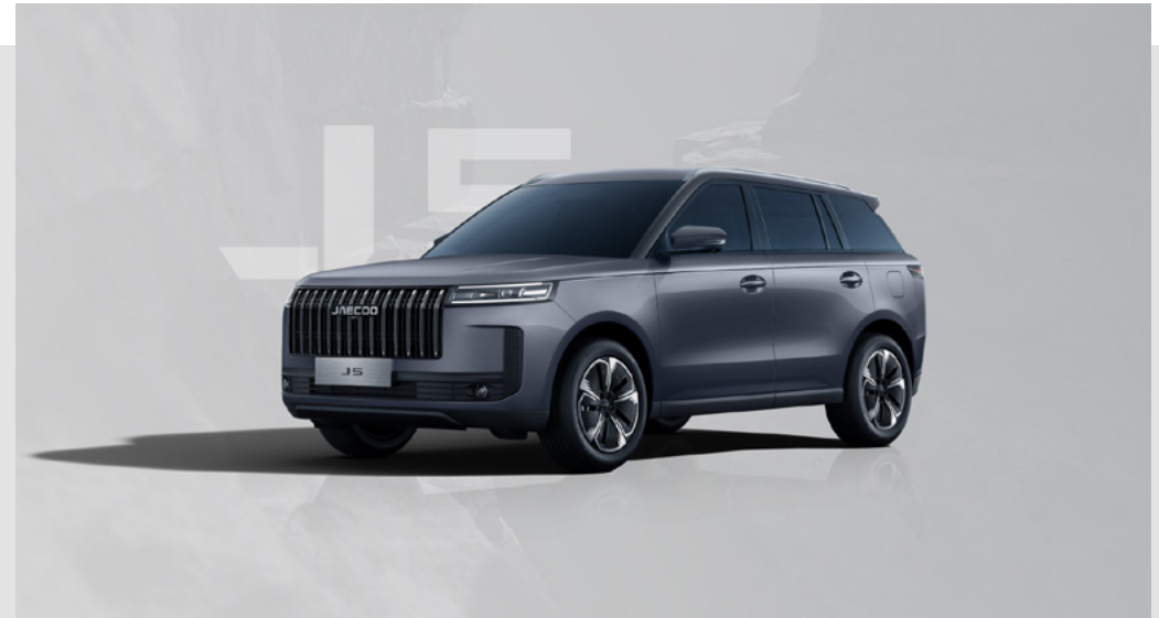
STONE GRAY (GV)