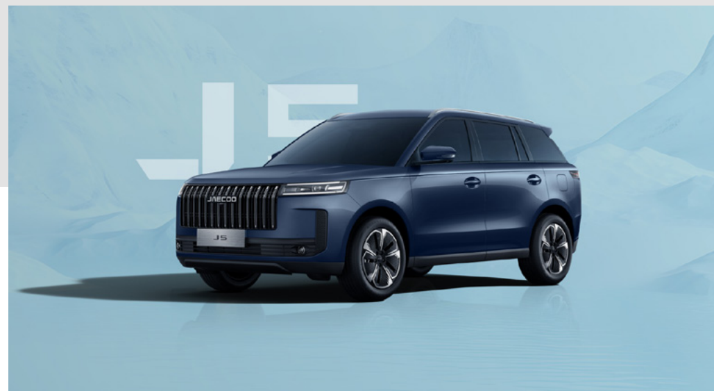
GLACIER BLUE (WS)