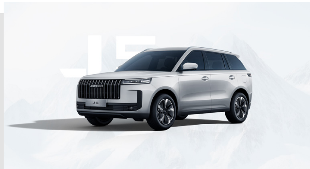
SNOW WHITE (BW)